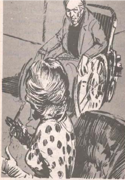
الفت (دونا) إلى مصدر الصوت بحدة ، ثم ضاقت عيناها الجميلتان وهي تتأمل صاحبه ..

— لعد إلى العمل .. لقد تلقيت هذه البرقية من شخص يعرفني جيدا ، دعاني فيها للحضور إلى هذه الفيلا لمناقشة عمل يحتاج إلى اتحاد جميع الأفراد .. أصدقك القول : لقد أثارت هذه البرقية شكوكي في البداية ، ولكن عدم إلقاء القبض على طمأنني إلى أن مرسل البرقية لا يريدني سوءا ؛ ولذلك حضرت . ثم اعتدلت ، ووجهت نظراتها إلى دون ( مايكل ) وهي تقول :