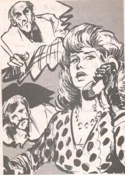
امتقع وجه ( حاييم ) ، على حين نفضن جين دون ( مايكل ) غضباً ، وبرقت عينا دونا ( ماريا ) وهى تسمع إلى المكالمة .

— هذا لأنك لا تفكر بالشكل الصحيح أينما العجوز ، برغم خبراتك السابقة فى عالم الخبرات .. أما أنا فقد أمرت بعض رجالى بمراقبة الهجوم على الفيلا من بعيد ، وإبلاغى بما سيسفر عنه الأمر ، ولا بدّ أنهم الآن قد تعقبوا ( أدهم صبرى ) ، وما هى إلا لحظات حتى يجبروننى أين ذهب .