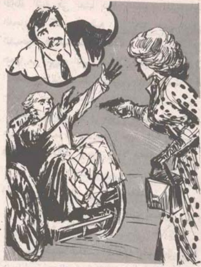
احسبت الكلمات في حلق ( حاييم ) ، وجمحت عيناه رعبًا عندما سحبت دونا ( ماريا ) إبرة مسدسها .

كان ( أدهم ) وزميلته ( منى ) قد أذهل أسلوبيهما الانتحارى الحارسين الباقين .. وقبل أن يطلق أحدهما النار أطاح رصاص ( منى ) بمسدس الأول ، على حين اندفع ( أدهم ) نحو باب الفيلا ، وأصابت رصاصة