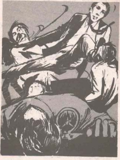
لو أن ساعة انقضت على رءوس العمالقة الأربعة فى تلك اللحظة ما كان وقعها أشد مما حدث ..

استغرقت المعركة بأسرها نصف دقيقة فقط ، حتى أن أحد السائرين فى الطريق لم تسح له الفرصة ليفعل شيئا ؛ بل تسمم معظمهم دهشة ، على حين ارتفعت بضع صرخات متفرقة من حناجر النساء ، قطعها صوت